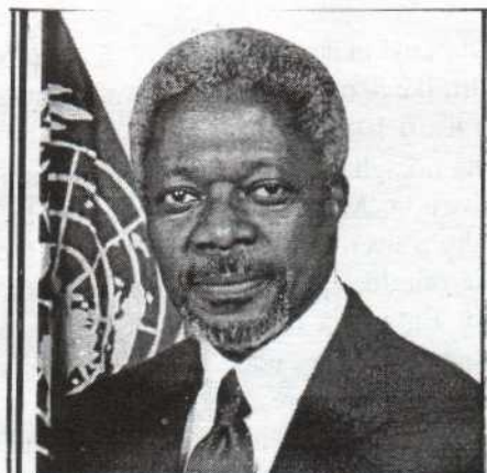
Foto nke Otu Jikotara Ụwa.

Odeakwukwọ Ọha nke Otu Jikotara Ụwa Boutros Kofi Annan.