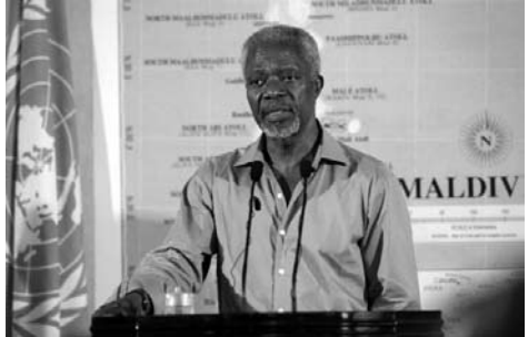
Генеральний секретар Кофі Аннан проводить брифінг для журналістів в ході поїздки по районах, що постраждали від цунамі 2004 року. Генеральний секретар є провідним миротворцем в світі і головним адміністративним співробітником Організації Об'єднаних Націй.

Всі ці організації мають свої власні органи управління, бюджети і секретаріати. Разом з Організацією Об'єднаних Націй вони складають єдину сім'ю, або систему Організації Об'єднаних Націй. Спільними зусиллями вони проводять технічне сприяння і надають практичну допомогу в інших формах практично у всіх економічних і соціальних сферах.