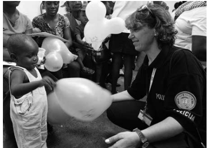
Співробітники цивільної поліції Організації Об'єднаних Націй роздають іграшки хворим дітям в лікарні Св. Даміана в Гаїті.

Миротворча діяльність Організації Об'єднаних Націй і її зусилля з підтримки миру зіграли свою роль у врегулюванні затяжних конфліктів в Центральній Америці. У 1989 році в Нікарагуа завдяки миротворчим зусиллям була забезпечена добровільна демобілізація сил руху опору, учасники якого здали свою зброю Організації Об'єднаних Націй. У 1990 році місія Організації Об'єднаних Націй спостерігала за виборами в Нікарагуа – це були перші вибори, що проходили під спостереженням Організації Об'єднаних Націй, в незалежній країні.