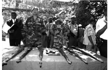
Миротворці Організації Об'єднаних Націй в Гаїті починають офіційний процес роззброєння місцевих ополченців зі складу колишніх озброєних сил Гаїті на церемонії в штаб-квартирі ополченців в березні 2005 року.

Було укладено і інші договори, які забороняють розробку, виробництво і накопичення запасів хімічної (1992 рік) і бактеріологічної (1972 рік) зброї, забороняють розміщення ядерної зброї на дні морів і океанів (1971 рік) і в космічному просторі (1967 рік), а також договори, що забороняють або обмежують інші категорії озброєнь. До лютого 2005 року 144 держави стали учасниками Оттавської конвенції 1997 року про заборону наземних мін. Організація Об'єднаних Націй закликає всі країни приєднатися до цієї конвенції і інших міжнародних договорів, що забороняють використання руйнівних видів зброї. Організація Об'єднаних Націй також підтримує зусилля із запобігання, припинення і викорінювання незаконної торгівлі стрілець-