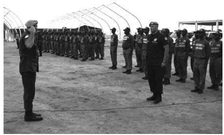
Цивільні співробітники Організації Об'єднаних Націй здійснюють підготовку поліцейських в Ліберії, де місія Організації Об'єднаних Націй приділяє особливу увагу захисту прав людини.

Об'єднаних Націй, співробітничав з урядами з метою забезпечити ефективніше дотримання ними прав людини, досягаючи запобігання порушенням, і тісно взаємодіє з правозахисними механізмами Організації Об'єднаних Націй. Комісія Організації Об'єднаних Націй з прав людини, що є міжурядовим органом, проводить відкриті засідання з метою розгляду питань щодо дотримання прав людини державами, ухвалення нових стандартів