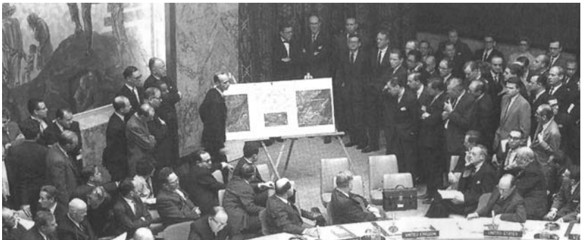
Сьогодні, як і в 1962 році, коли в Раді Безпеки обговорювалася кубинська ракетна криза, Організація Об'єднаних Націй забезпечує засоби для вирішення суперечок мирним шляхом.

Організація Об'єднаних Націй добилася вражаючих результатів. Так, їй вдалося зняти гостроту Карибської кризи в 1962 році та кризи на Близькому Сході в 1973 році. У 1988 році зусилля Організації Об'єднаних Націй щодо мирного врегулювання дозволили припинити ірано-іракську війну, а наступного року завдяки переговорам, що проводилися під егідою Організації Об'єднаних Націй, радянські війська були виведені з Афганістану. У 90-і роки Організація Об'єднаних Націй сприяла відновленню суверенітету Кувейту й відіграла важливу роль в припиненні громадянських воєн в Гватемалі, Камбоджі, Мозамбіку, Сальвадорі і щодо врегулювання або запобігання конфліктам в інших країн.