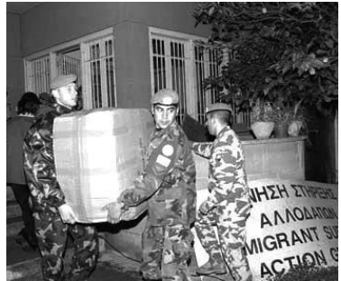
Рада Безпеки організувала близько 60 миротворчих операцій. На цій фотографії військовослужбовці сил, розміщених на Кіпрі, допомагають вантажити гуманітарну допомогу для жертв руйнівного цунамі, події в 2004 році в Південній Азії.

До складу Ради входять 54 члени, які обираються Генеральною Асамблеєю на три роки. Протягом року Рада періодично проводить засідання, збираючись в липні на свою основну сесію, в ході якої на засіданні високого рівня обговорюються найважливіші економічні, соціальні та гуманітарні питання.