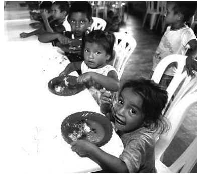
Організація Об'єднаних Націй організовує для внутрішньо переміщених дітей в Колумбії консультування з психологічних питань, базову освіту і гаряче харчування.

Мандати спеціалізованих установ охоплюють практично всі сфери соціально-економічної діяльності. Ці установи надають країнам всього світу технічну допомогу і надають їм практичне сприяння в інших формах. Діючи в співпраці з Організацією Об'єднаних Націй, вони допомагають розробляти політику, визначати керівні принципи, мобілізувати підтримку і залучати кошти. Світовий банк, наприклад, в 2004 фінансовому році надав більш ніж 100 країнам, що розвиваються, більше 20,1 млрд. дол. США у вигляді позик для досягнення цілей розвитку.