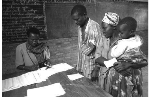
Організація Об'єднаних Націй здійснює спостереження за процесом виборів в Бурунді. На цій фотографії місцеві сільські жителі беруть участь в голосуванні в ході національного референдуму з перехідного етапу, що проводився в лютому 2005 року.

Завдяки своїй миротворчій діяльності Організація Об'єднаних Націй, використовуючи дипломатичні механізми, допомагає протидіяти сторонам прийти до згоди. Рада Безпеки в рамках своїх зусиль з підтримки міжнародного миру і безпеки може рекомендувати шляхи запобігання конфлікту і відновлення або забезпечення миру, наприклад за допомогою переговорів чи звернення до Міжнародного Суду.