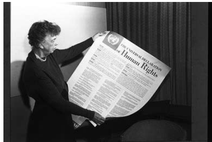
Співробітники цивільної поліції Організації Об'єднаних Націй роздають іграшки хворим дітям в лікарні Св. Даміана в Гаїті.

Зараз, коли нормотворча діяльність близька до завершення, Організація Об'єднаних Націй в своїх зусиллях в області прав людини переносить акцент на практичне здійснення встановлених норм. Верховний комісар з прав людини, що координує правозахисну діяльність системи Організації