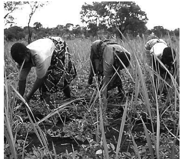
Жінки-біженці працюють на громадських полях в рамках організованого проекту УВКБ з досягнення самозабезпечення в Об'єднаній Республіці Танзанія.

Мабуть, найдраматичнішим стихійним лихом останніми роками став землетрус, що викликав цунамі, в Індійському океані. Рано вранці в неділю, 26 грудня 2004 року, біля західного узбережжя північної частини Суматри стався сильний землетрус потужністю 9,0 балів за шкалою Ріхтера, яке призвело до виникнення величезних цунамі, що досягали у висоту 10 метрів (33 фути) і рухалися поверхнею Індійського океану зі швидкістю 500 кілометрів (310 миль) на годину. Цунамі обрушилися на прибережні райони в Індії, Індонезії, Шрі-Ланки, Таїланду, Мальдівських островів, М'янми, Сейшельських островів та Сомалі. Було підраховано, що за станом на квітень 2005 року більше 217 000 чоловік загинули, 51 000 зникли без вісті і більше півмільйона чоловік лишилися без притулку.