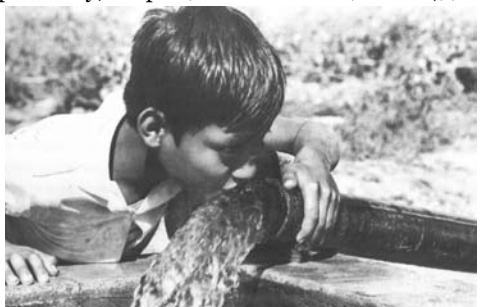
Система Організації Об'єднаних Націй давно виступає за раціональне використання життєво важливих водних ресурсів.

На Самміті тисячоліття у вересні 2000 року світові лідери затвердили в Декларації тисячоліття комплекс цілей в сфері розвитку, що передбачають викорінювання крайньої бідності і голоду; забезпечення загальної початкової освіти;