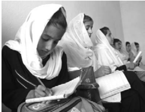
Завдяки невинним зусиллям системи Організації Об'єднаних Націй хлопчики і дівчатка в країнах, що розвиваються, в усьому світі мають доступ до освіти.

Глобальний фонд боротьби зі СНІДОМ, туберкульозом і малярією, із закликом щодо створення якого Генеральний секретар в 2001 році, є спільною ініціативою урядів, громадянського суспільства, приватного секто-