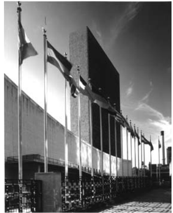
Центральні установи ООН в Нью-Йорку, де збираються представники 191 країни для вироблення консенсусу із глобальних проблем.

У вересні 2005 року члени Організації Об'єднаних Націй зберуться в Нью-Йорку для того, щоб відсвяткувати шістдесяті річницю всесвітнього органу і прийняти рішення з метою втілення в життя колективного бачення, яке знайшло своє відображення в прийнятій у вересні 2000 року Декларації тисячоліття. Тоді держави-члени, представлені на найвищому рівні, включаючи 147 керівників держав і урядів, поставили цілі, що піддаються кількісній оцінці, в кожній сфері діяльності Організації Об'єднаних Націй. І тепер міжнародне співтовариство знову збирається на другий самміт високого рівня, з тим щоб забезпечити досягнення цих цілей. В зв'язку з цим Генеральний секретар презентував рекомендації щодо здійснення змін, направлених на вирішення реальних завдань. У документі «При більшій свободі» міститься заклик до вжиття конкретних заходів в таких сферах, як розвиток, безпека і права людини, а також з метою перебудови міжнародних установ, включаючи Організацію Об'єднаних Націй, для того, щоб ефективніше вирішувати ці першочергові завдання. (Повний текст доповіді можна знайти в Інтернеті за адресою: www.un.org/largerfreedom ).