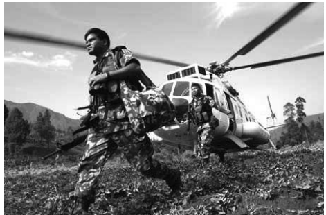
Миротворці Організації Об'єднаних Націй, не зважаючи на небезпеку, прямують туди, де вони потрібні.

В рамках своїх зусиль з підтримки миру та міжнародної безпеки Рада Безпеки розпочинає операції Організації Об'єднаних Націй щодо підтримки миру і визначає рамки повноважень і мандат. Більшість таких операцій припускає участь військовослужбовців, які стежать за дотриманням режиму припинення вогню або створюють буферну зону, доки за столом переговорів ведуться пошуки довгострокових рішень. У інших операціях можуть брати участь цивільні поліцейські або інші цивільні фахівці, які допомагають організувати вибори або здійснювати