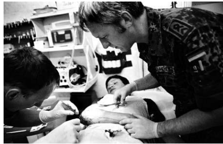
Медична бригада у складі Місії Організації Об'єднаних Націй в Грузії в травні 2004 року надає першу допомогу юному жителеві Галі.

Миротворчі сили Організації Об'єднаних Націй на Кіпрі продовжують здійснювати спостереження за лініями припинення вогню, підтримують порядок в буферній зоні і здійснюють гуманітарну діяльність на цьому розчленованому острові. Їх присутність створює сприятливі умови для дипломатичних зусиль Генерального секретаря і його спеціальних радників, направлених на стимулювання переговорів і досягнення всеосяжного врегулювання.