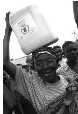
Щороку Світова продовольча програма організовує харчування приблизно для 100 000 голодуючих людей, включаючи цю жінку і її сім'ю в Бурунді.

СПП є найбільшою в світі гуманітарною організацією за поданням надзвичайної продовольчої допомоги. У 2003 році вона надала 6 млн. тонн