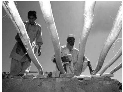
Біженці, що повертаються з Пакистану до Афганістану, відновлюють за сприяння УВКБ свої будинки.

У зв'язку з наданням гуманітарної допомоги Організації Об'єднаних Націй доводиться долати серйозні проблеми матеріально-технічного постачання і забезпечення безпеки на місцях. Гуманітарному персоналу не дають доступу до тих, що мають потребу, а сторони конфліктів умисне завдають ударів по мирних жителях і працівниках, які займаються наданням допомоги. За період з 1992 року у складі гуманітарних операцій загинули близько 220 цивільних співробітників Організації Об'єднаних Націй. Протягом року, що закінчився 30 червня 2004 року, було здійснено більше 120 нападів на співробітників Організації Об'єднаних Націй, включаючи 10 випадків зґвалтувань і сексуального насильства, а також 139 випадків домагань. Було