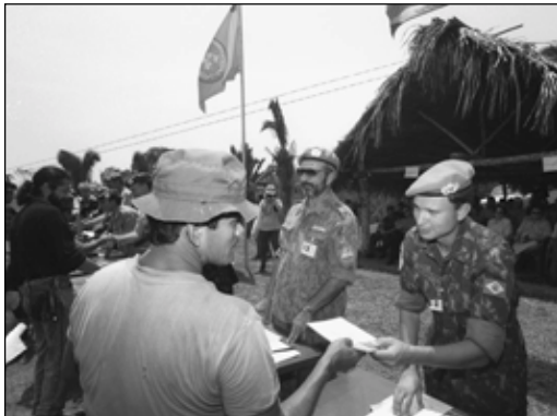
БМТ сурати (Ж.Олссон)

Бирлашган Миллатлар Ташкилоти бешта ўнйиллик мобайнида (бу муддат давомида беш марта кенг қўламдаги уруш олови аланга олган) Араб — Исроил можаросига катта диқ-