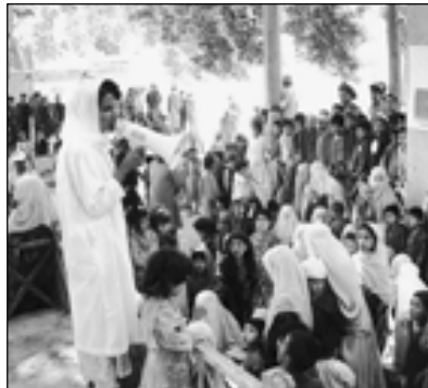
БМТ сурати (Ж.Хартли)

Масалан, Бутунжаҳон банки тараққиёт мақсадлари учун ҳар йили 25 миллиард АҚШ долларидан ортиқроқ ёрдам