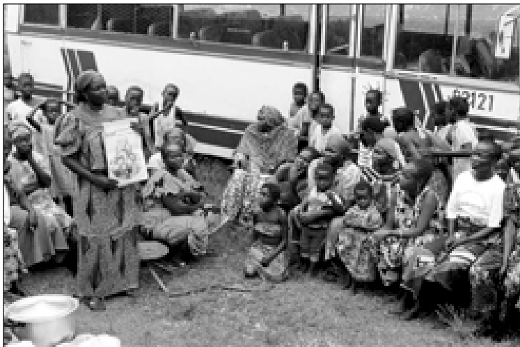
БМТ сурати (Е.Шнайдер)

Бирлашган Миллатлар Ташкилоти 130 дан ортиқ мамлакатда энг оддий табақалар ўртасида СПИД ва бошқа юқумли касаликларга қарши кураш муаммоси бўйича олиб борилаётган таълим-тарбия ишини қўллаб- қувватламоқда.