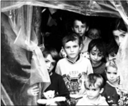
Олий комиссар бошқармаси сурати (У.Мейсснер)

моаларнинг ўз яшаш имкониятларини ўз кучлари билан таъминлай олмай қолишларига олиб келади ва жуда катта қийинчиликлар туғдиради.