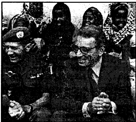
(Sary : Ny Sekretera jeneraly taloha, Atoa Boutros-Boutros Ghali, miaraka amin'ireo miaramilan'ny Firenena Mikambana, tany Somalia).

Niezaka namerina ny filaminana ny ONUSOM II. nanao ny fampihavanam-pirenena ary nanampy tamin'ny fanarenana ny toekarena sy ny fiaraha-monina Somaliana; nifarana ny volana Marsa 1995 io iraka ONUSOM II io. Sampan'asan'ny Firenena Mikambana maro no nitondra fanampiana namonjena ain'olona tao anaty sarotra.